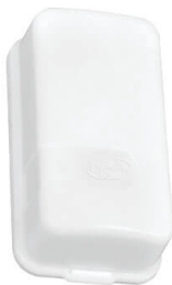
MÓDULO CONTACTO WI-FI CONNECT