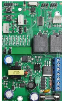
LEGERO: CENTRAL AGILITY LEGERO